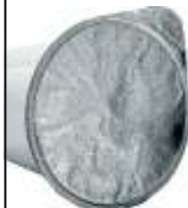
Coperchi in alluminio dello yogurt