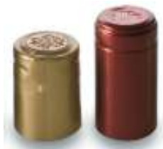
Capsule bottiglie di vino