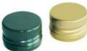
Tappi a vite per bottiglie