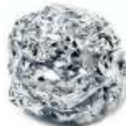
Involucro alluminio per dolci o cioccolata