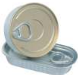
Scatoletta per pesce/carne