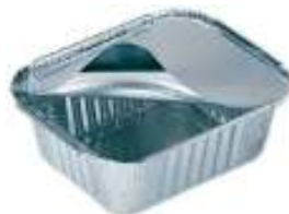
Vaschetta alimenti e per cibo di animali