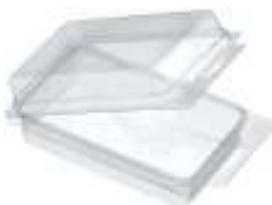
Blister trasparenti preformati