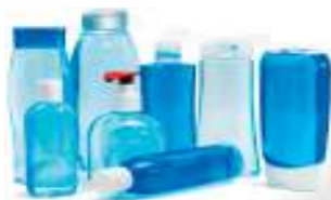
Flacone shampoo Dispenser