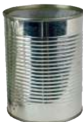
Barattolo in alluminio