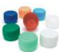
Tappi in plastica