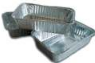
Vassoi per cottura cibi