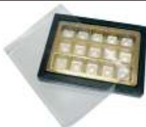
Vassoio scatola di cioccolatini