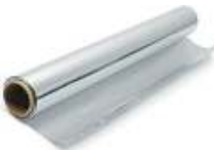
Fogli tipo domopack