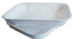
Vaschetta per alimenti