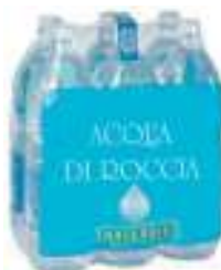
Film per cluster 6 bottiglie