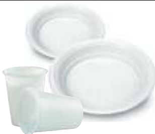
Piatti e bicchieri in plastica