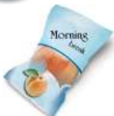
Sacchetto merendina o snack